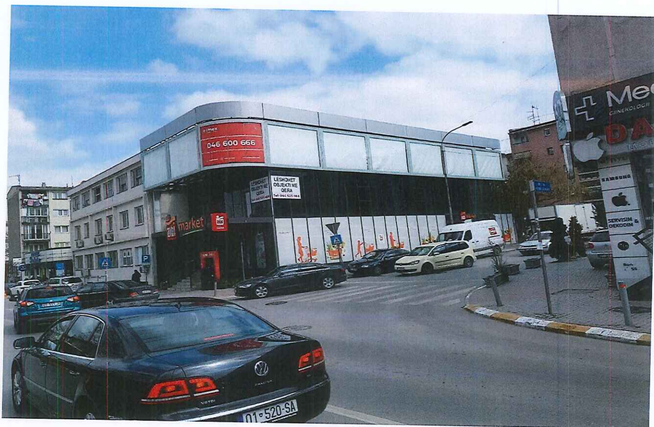
Foto nga Tereni ku duket pjesa nga rruga „ Dëshmorët e Kombit dhe pjesa nga rruga „Henri Dunan „