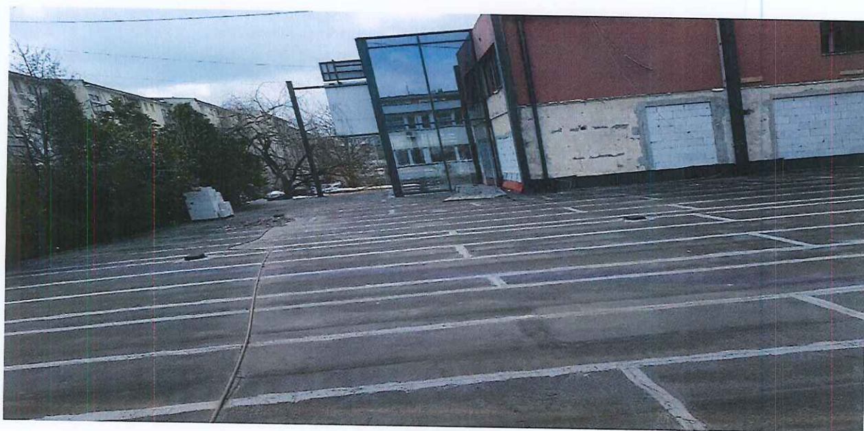
Foto nga tereni mbrapa objektit gjegjesisht plloka e katit përdhese ( Pjesa e Oborrit të Ndërtesës ) Parcelat kadastrale numer ...